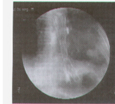
支架术后 X 线照片